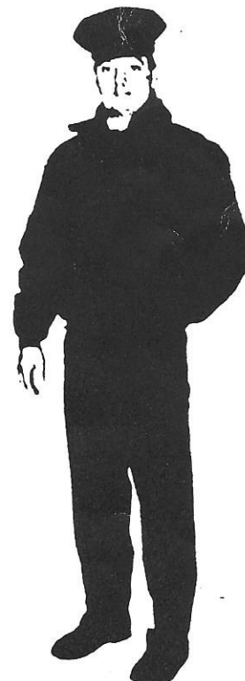
4. Ubiór służbowy zimowy z kurtką uniwersalną krótką