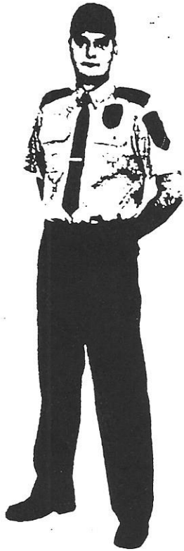
1. Ubiór służbowy letni z czapką typu baseball