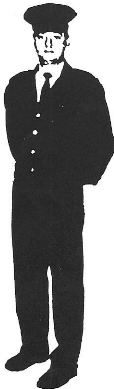
3. Ubiór służbowy letni z wiatrówką